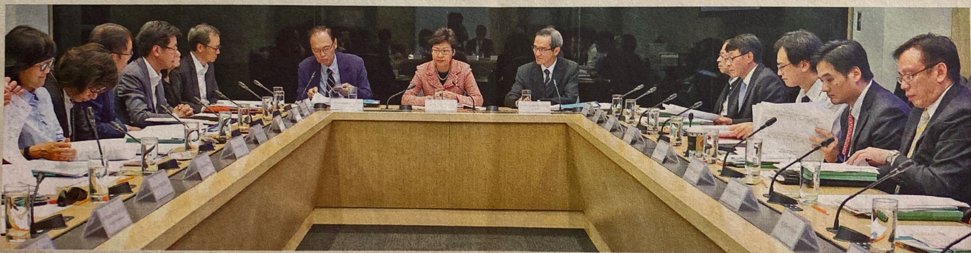
土地供應專責小組昨午舉行首次會議，據了解，特首林鄭月娥（中）出席了首半小時會議，她指出，香港並非沒有可以興建樓宇的土地，但多年來缺乏開拓土地來源的共識。專責小組預料明年第一、二季展開公眾諮詢，最快明年第三季向政府提交建議報告，報告將建基於公眾諮詢的共識。